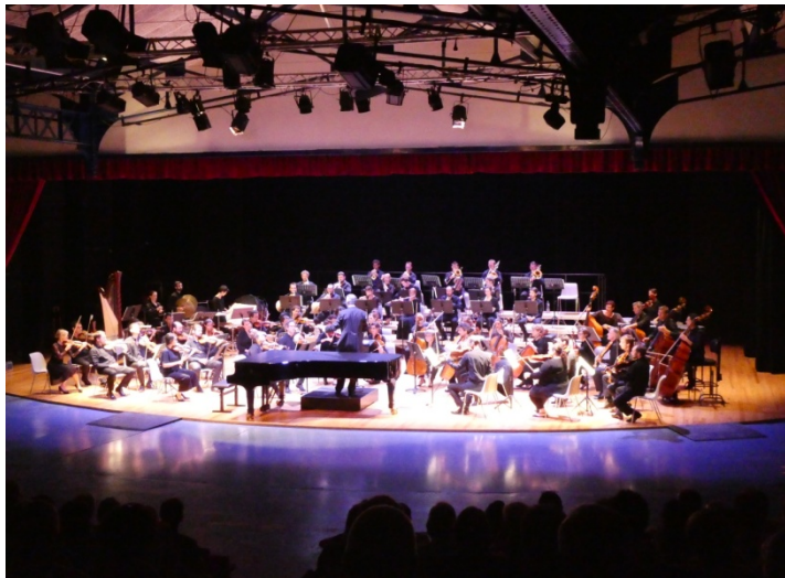
Orchestre symphonique à la Halle aux Grains