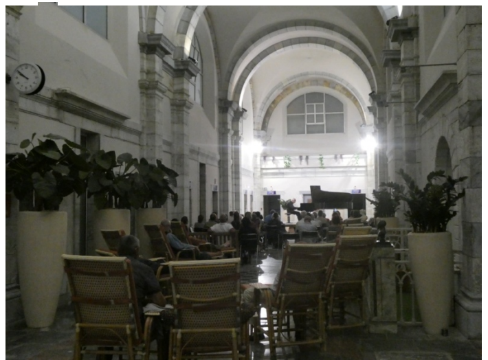
Thermes de Barèges