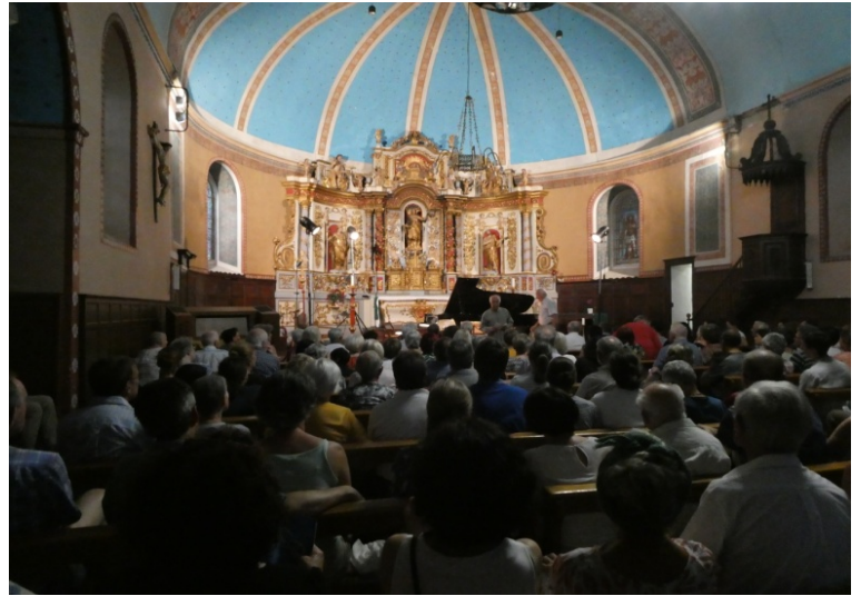
Rétable baroque de Gerde