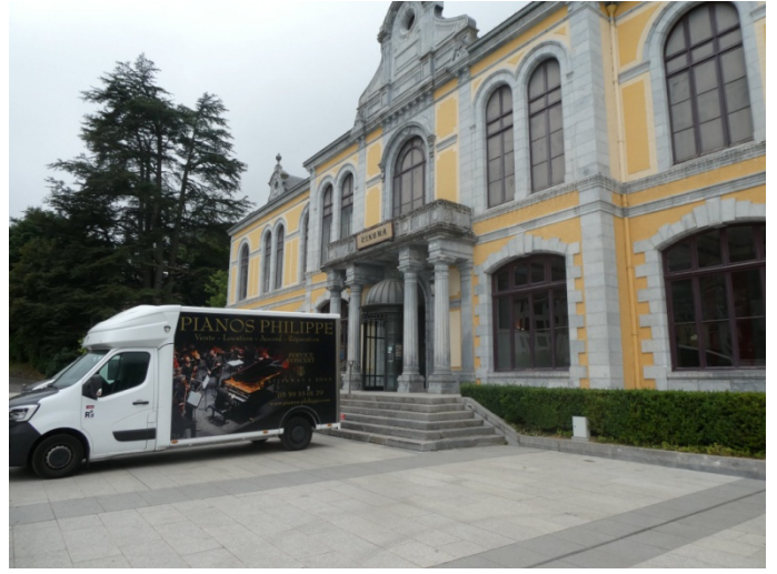
Cinéma de Cauterets