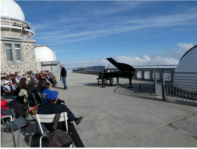
Concert au Pic du Midi